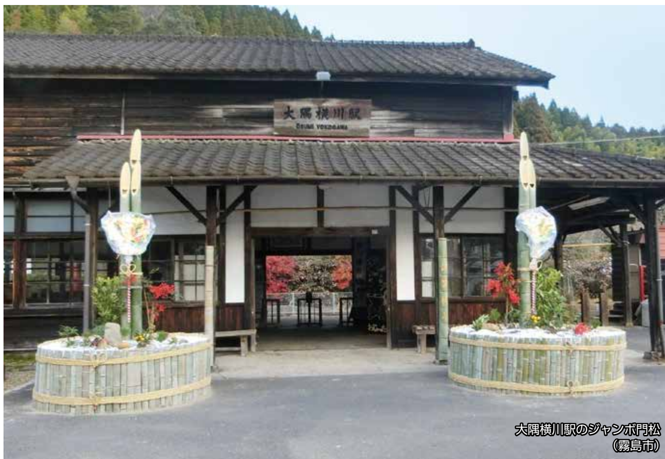
大隅横川駅のジャンボ門松 (霧島市)