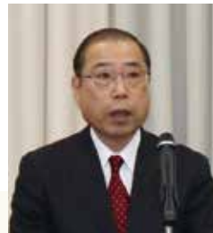
松里県議会議員長