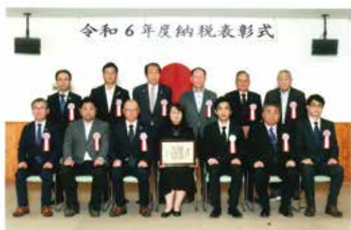
令和6年11月13日 於：大隅税務署会議室